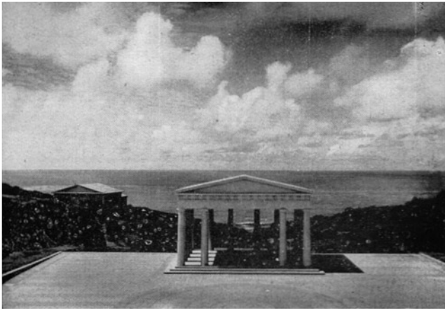
BLICK AUF DEN OZEAN VOM FREILICHT-THEATER INTERNATIONALES THEOSOPHISCHES HAUPTQUARTIER POINT LOMA, CALIFORNIEN