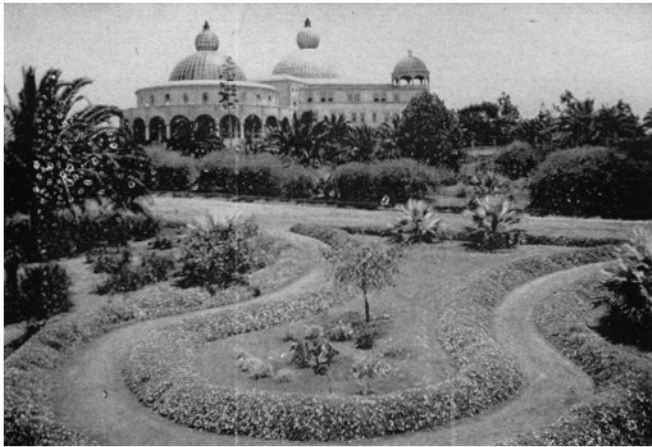
FRIEDENS-TEMPEL UND UNIVERSITÄT INTERNATIONALES THEOSOPHISCHES HAUPTQUARTIER POINT LOMA, CALIFORNIEN