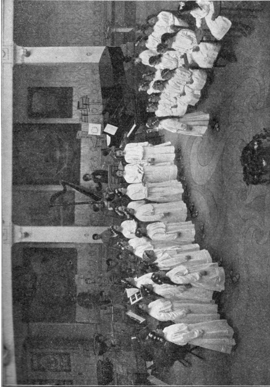
RAJA YOGA-SCHÜLER IM MUSIKSAL, DER RAJA YOGA-AKADEMIE, POINT LOMA, CALIFORNIEN