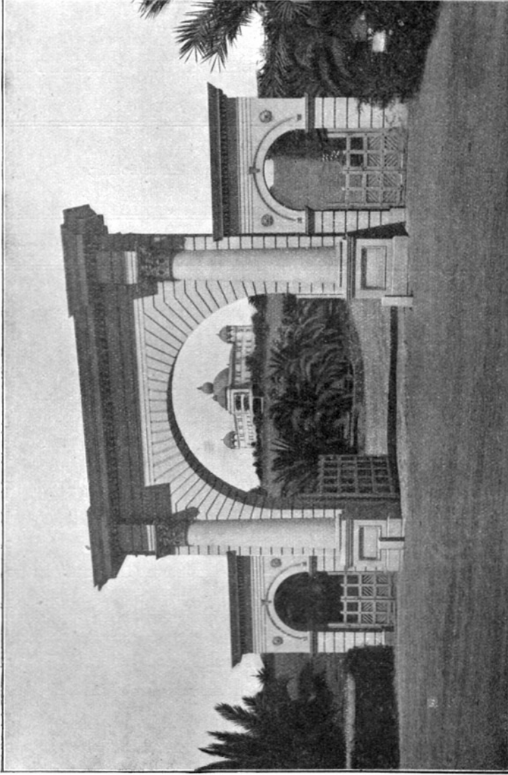
HAUPTINGANG ZUM INTERNATIONALEN HAUPTQUARTIER DER UNIVERSALEN BRUDERSCHAFT UND THEOSOPHISCHEN GESELLSCHAFT e ZU POINT LOMA, CALIFORNIEN IM HINTERGRUNDE DIE RAJA YOGA-AKADEMIE