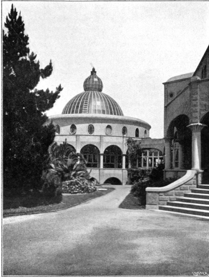
EIN BLICK AUF DEN ARISCHEN GEDÄCHTNIS-TEMPEL VON SÜDEN INTERNATIONALES THEOSOPHISCHES HAUPTQUARTIER POINT LOMA, CALIFORNIEN