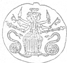
HECATE aus einem eingravierten Edelstein, Rom

In der klassischen Symbologie war der Mond das Zeichen für Hekate, eine dreiköpfige Gottheit. Das deutet einen dreifachen Charakter des Mondes an, denn die Gottheit hatte Macht