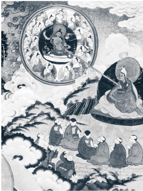
Tson-kha-pa und Schüler, die eine Erleuchtung von Manjushri erlangen

ihn herauszuholen. Als der Vater des Knaben kommt und sieht, dass sein Sohn in die Schmutzgrube gefallen ist, ist sein einziger Gedanken, ihn zu retten, und ohne Abscheu springt er in die Schmutzgrube und zieht ihn heraus.