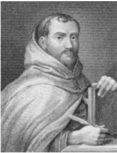
Johannes vom Kreuze

Hier schlich sich unser Krieger/Geliebter fort, mit schlafenden Fähigkeiten, Leidenschaften und Wünschen, um die Geliebte zu finden – um sich mit seinem göttlichen Selbst zu vereinigen. Wie sehr gleicht diese Sprache dem buddhistischen Bericht über den Prinzen Siddhārtha, der in der Dunkelheit der Nacht seinen königlichen Palast verließ, als seine Familie, Wächter, sogar die Tiere – d. h. alle seine Gedanken und Wünsche – tief schliefen. Nur sein Geist war wach. Nachdem er kürzlich die drei erweckenden Zeichen gesehen hatte – Alter, Krankheit und Tod – war er von Kummer zermürbt und entschlossen einen Weg zu finden, den Schmerz der Welt zu beenden. Er konnte an nichts anderes denken: Der gesamten Glanz seiner Vergangenheit hatte aufgehört zu existieren, war in die Nacht verschwunden.