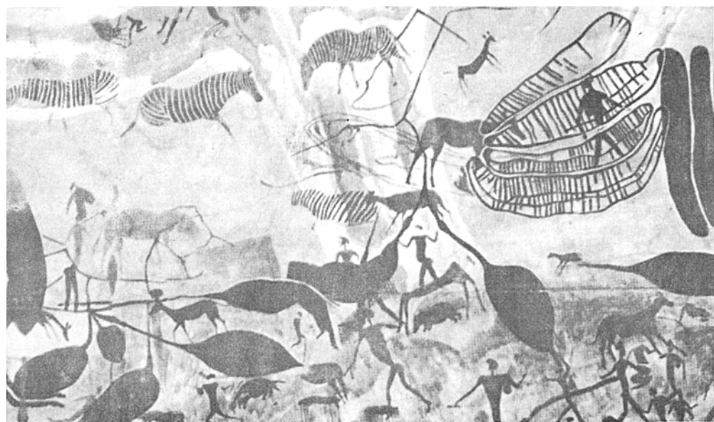
Felsenzeichnung von Buschmännern

noch Platz; und obgleich sie abstoßend sein mögen, werden sie nie wegen ihrer Häßlichkeit verurteilt, denn ist nicht auch der Bruder Geier genauso ein Teil des Lebensstromes wie die Sonne, der Wind und der Buschmann selbst?