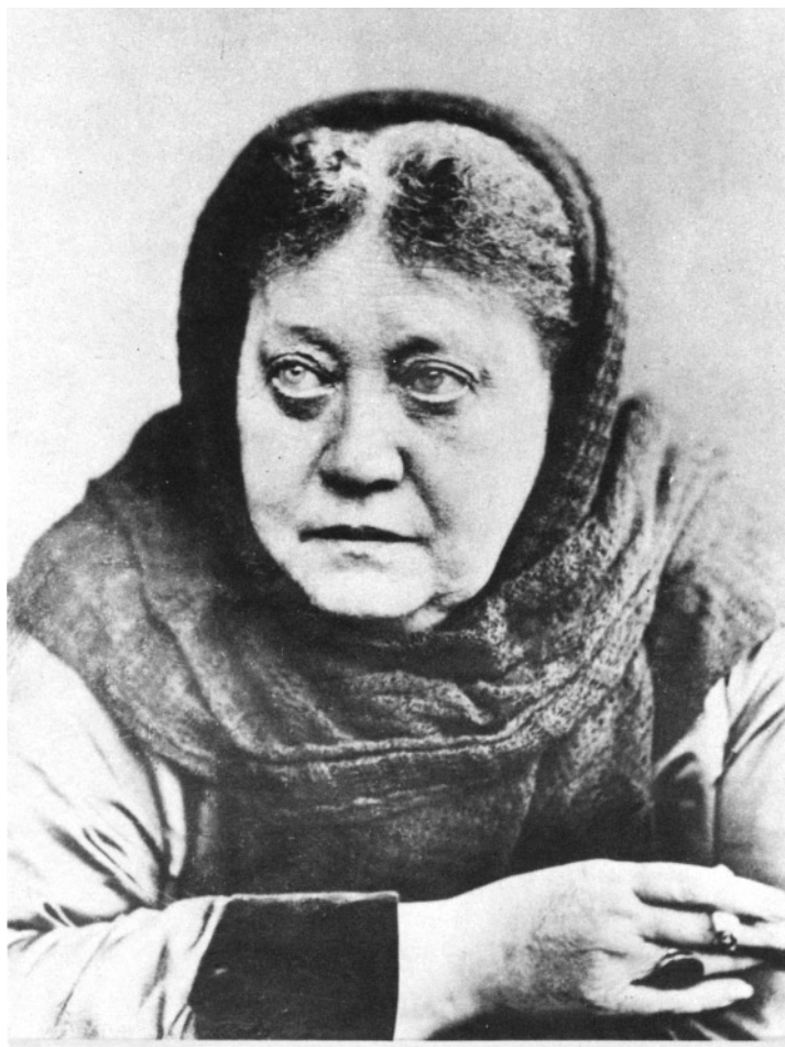
HELENA PETROVNA BLAVATSKY 11. - 12. August 1831 - 8. Mai 1891