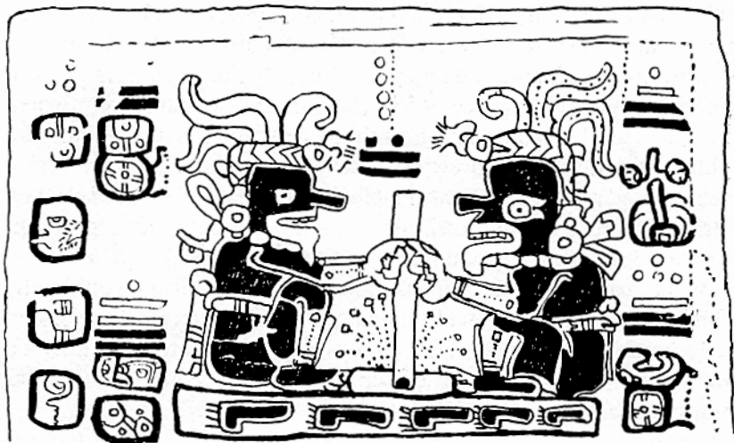
»Und die Jungen machten mit einem Steinbohrer Feuer« ( Popol Vuh , S. 101). Abbildung aus dem Madrid Codex, gezeichnet von C. A. Villacorta.

deren zyklische Bewegungen und Phasen in ihren Kalendereintragen peinlich genau festgehalten sind. Dazu waren sie noch imstande, mit Verstand und Geschicklichkeit die Gabe des Feuers zu gebrauchen, die Tohil ihnen gegeben hatte. Damit und mit dem Wissen, das sie von den göttlichen Tagwächtern bekommen hatten, die eine Zeitlang weiterhin ihr Reich regiert hatten, entwickelten die Mayas eine Zivilisation, deren Kunstwerke und Architektur, deren mathematische und astronomische Kenntnisse uns noch immer in Erstaunen versetzen.